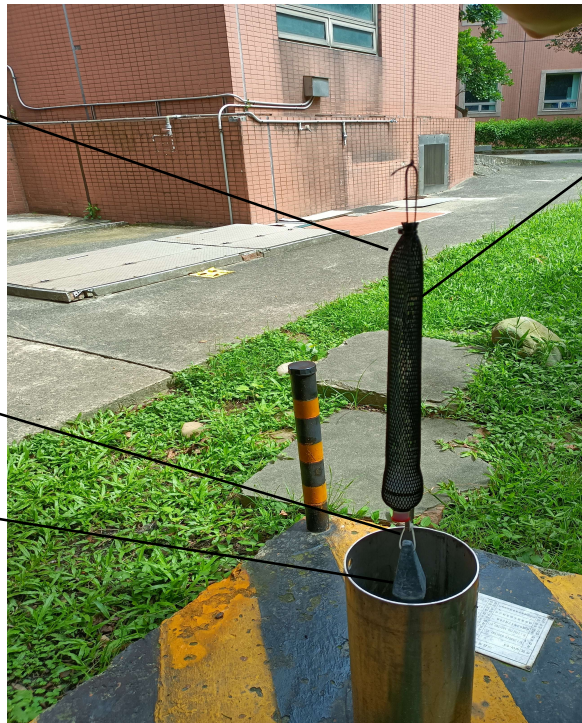
圖二 監測井地下水揮發性有機物被動式擴散採樣袋採樣