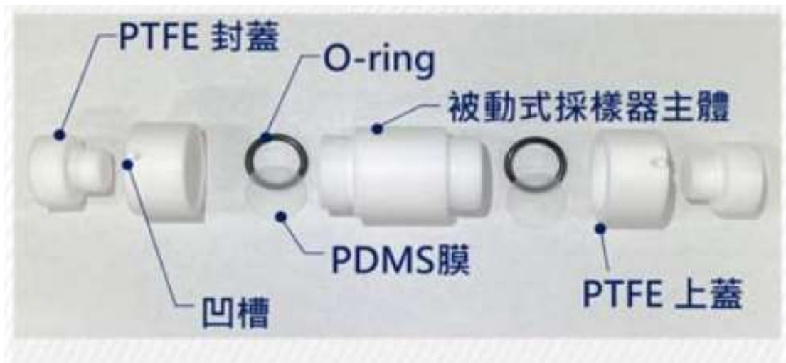
圖三 被動式採樣器