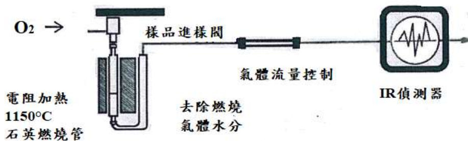
圖二 紅外線偵測含硫量測定儀：燃燒方法 B (1150°C)