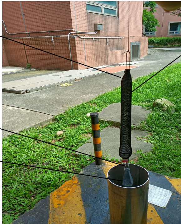
圖二 監測井地下水揮發性有機物被動式擴散採樣袋採樣