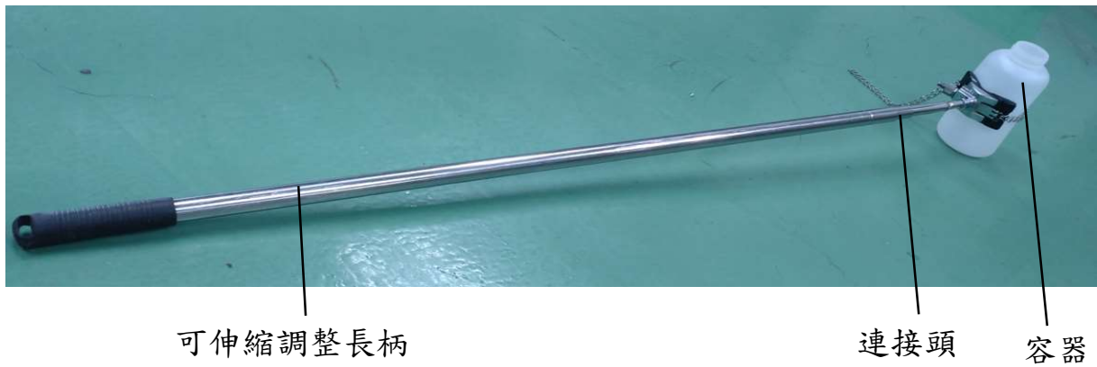
圖二 表層水採樣器