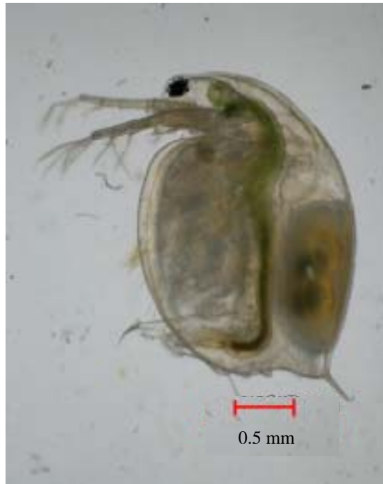
圖二、含冬卵之 Daphnia magna