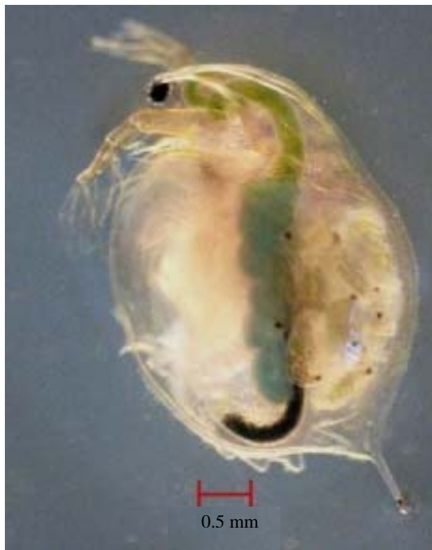
圖一、 Daphnia magna 雌性成蚤